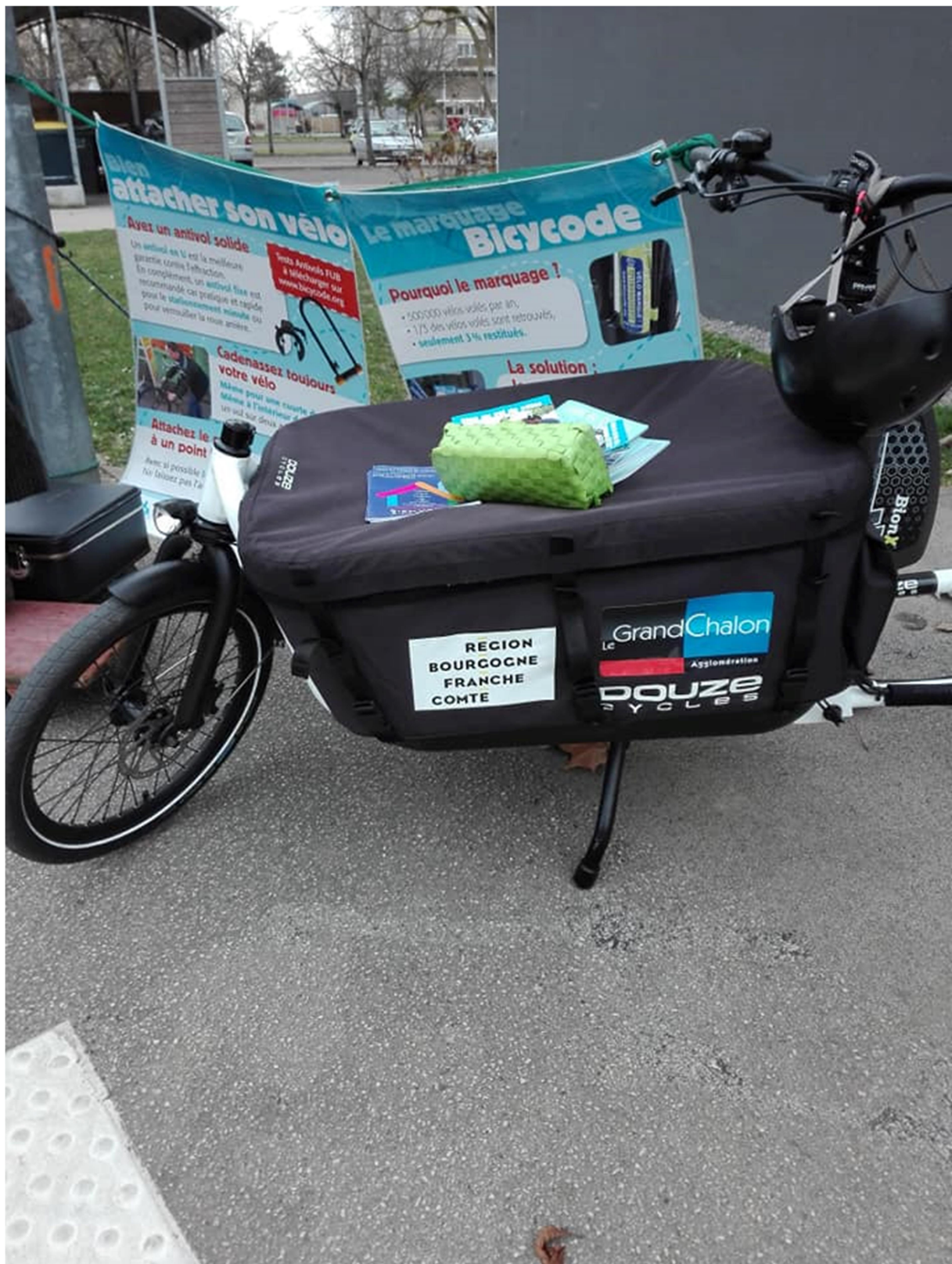
De la sensibilisation pour bien attacher son vélo et le protéger contre le vol avec le marquage Bicycode sont des activités recommandées dans le plan national vélo, qui font partie de l'atelier vélo.