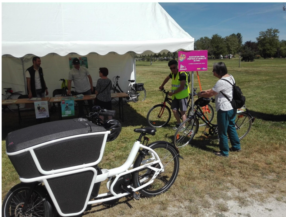
Découvrir des nouveaux dispositifs du Service Mobilité du Grand Chalonn